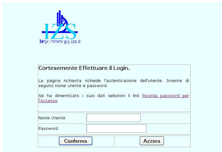
Figura 2 - Pagina di autenticazione dell'accesso.

L'accesso alla procedura avviene attraverso una pagina di autenticazione. L'utente collegato deve introdurre le proprie credenziali ossia la propria username e la password. Queste informazioni permettono, in caso di autenticazione, l'associazione di un profilo utente che permette di 'trattare' l'utente stesso in base alla sua funzione specifica (veterinario ASL, capo area tematica ASL, responsabile del Servizio di Prevenzione, altro Istituto Zooprofilattico Sperimentale, Ambulatorio Veterinario, Libero Professionista ed altro). Esistono delle funzioni di supporto che permettono di modificare la password o che aiutano l'utente a ricordarla.