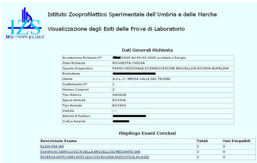
Figura 4 - Pagina di presentazione degli esami effettuati.

A questo punto, attraverso lo stesso meccanismo di navigazione e come presentato nella figura seguente, l'utente può avere accesso alle informazioni circa i risultati delle prove sui vari campioni esaminati.